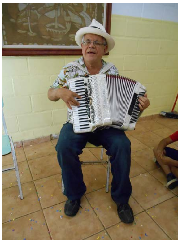
Heraldo: amigo do Remanso Fraterno