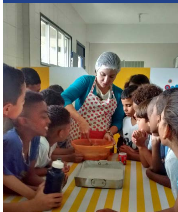
Produção do bolo