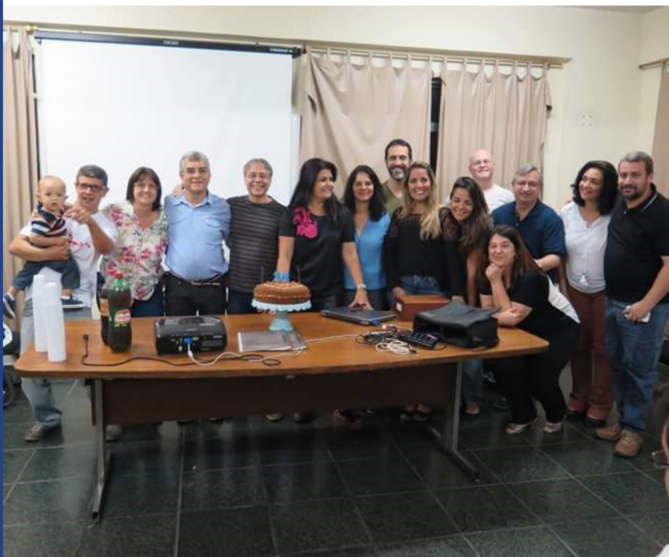
Jovens das gerações anteriores reunidos