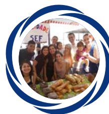
Mocidade homenageia os 36 anos da SEF