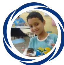
Fazendo bolo e aprendendo Química