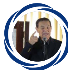
X Seminário com Divaldo Franco