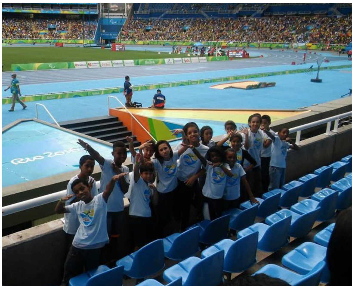
Alunos nas Paralimpíadas

Puderam participar da cerimônia de entrega das medalhas, sentindo a vibração da torcida e ainda tiveram a sorte de conhecer alguns outros atletas de São Tomé e Príncipe, que estavam na arquibancada; o entrosamento com eles foi algo muito especial.