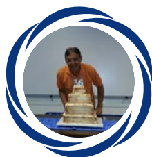
36 anos da SEF