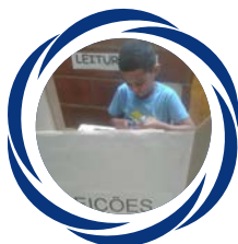
Exercício à cidadania