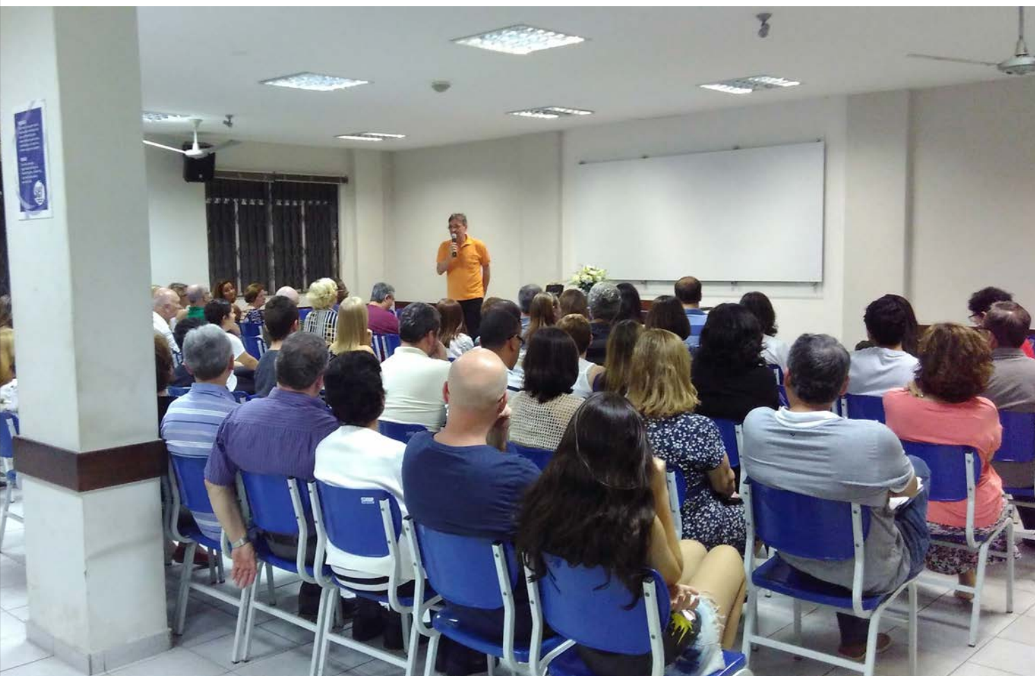
Todos reunidos no salão prestigiando a comemoração