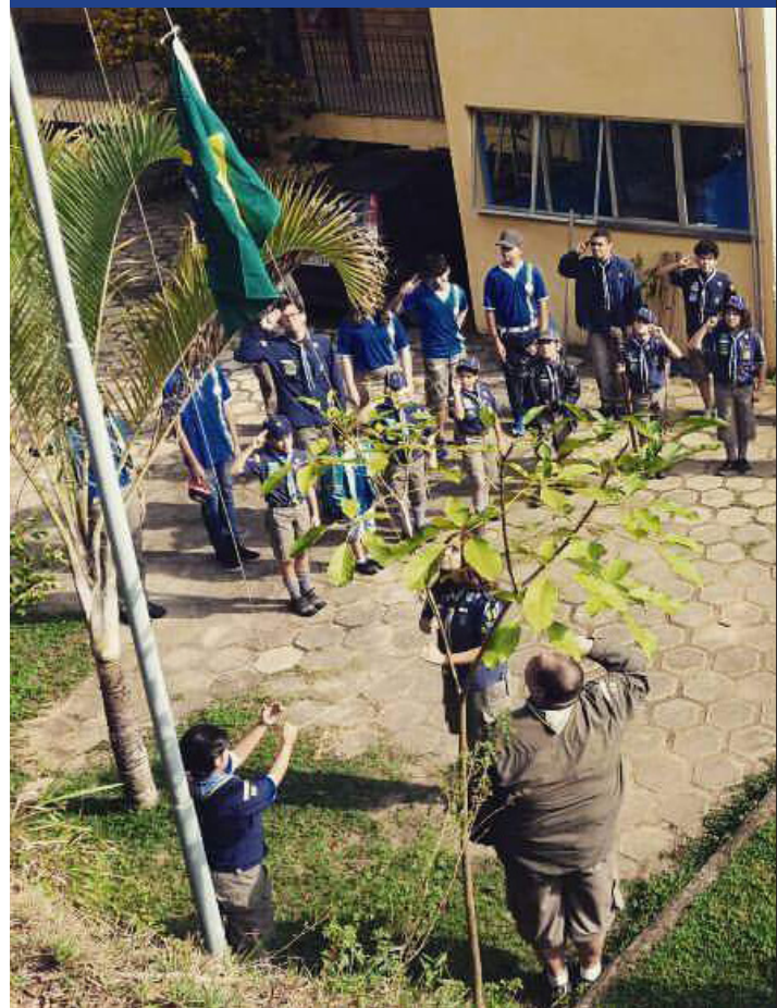
Momento do Hino Nacional cantado pelo Grupo de Es