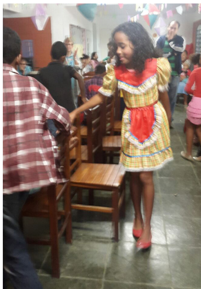
Dança das Cadeiras anima as crianças

Com dança da cadeira, quadrilha e muita música típica, as crianças se esbaldaram junto com seus familiares.