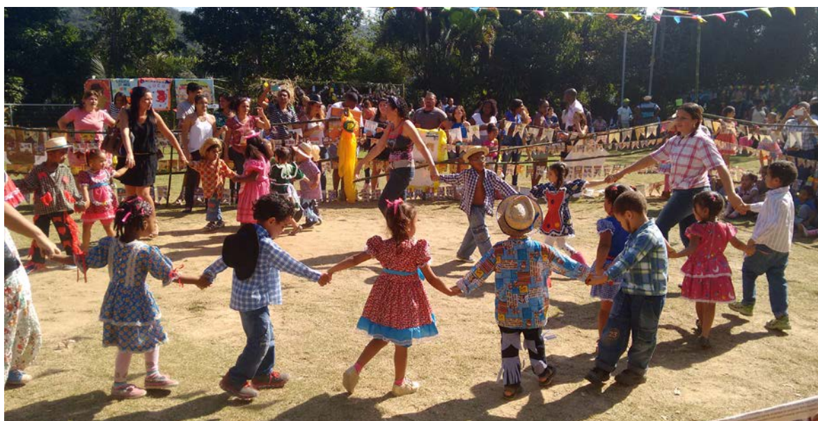
Muita alegria na dança de roda