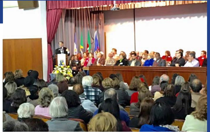
Anfitriato da Universidade Católica