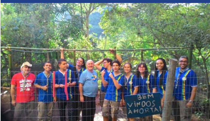
Equipe do AMAR e Escoteiros