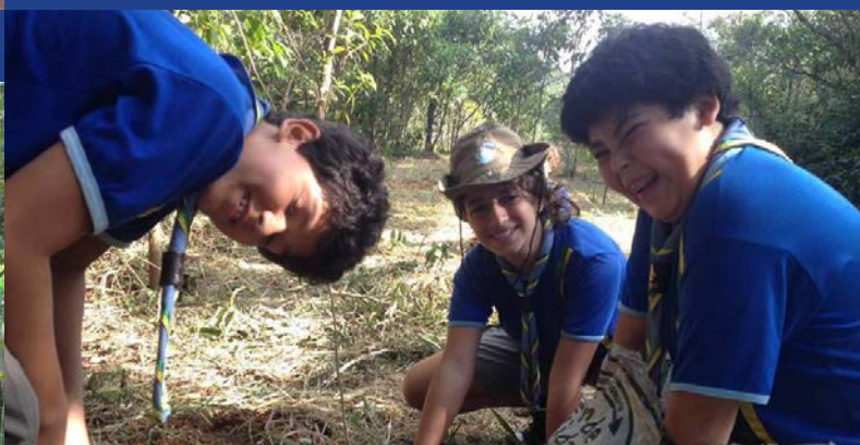
Escoteiros semeando a terra