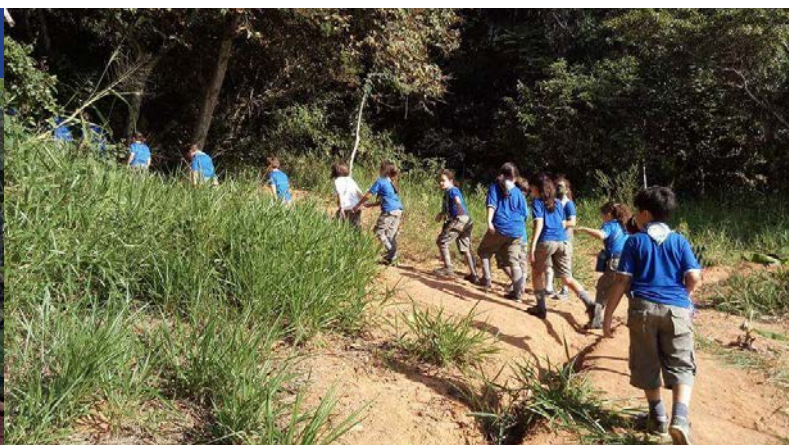
Explorando as trilhas do Remanso Fraterno