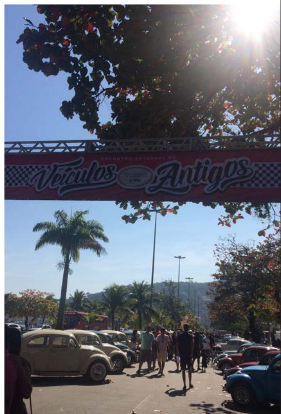
Pátio da Exposição