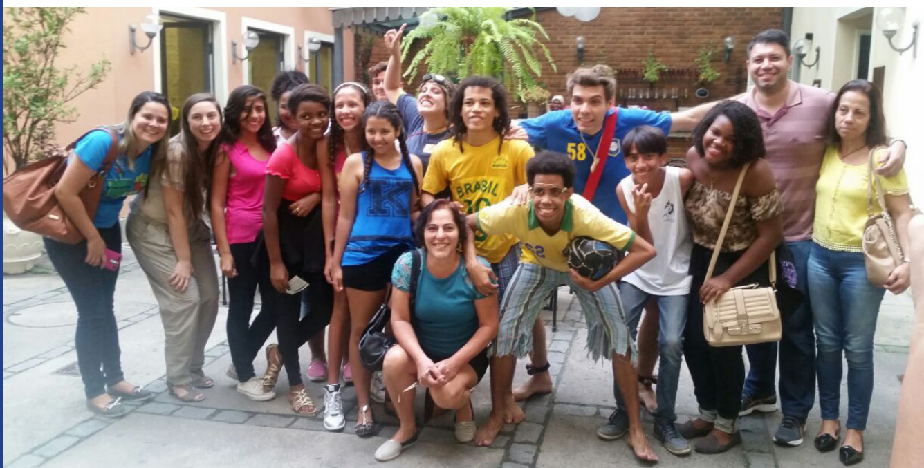
Jovens do Acolher ao lado do elenco do espetáculo teatral “Pedro é Eu”