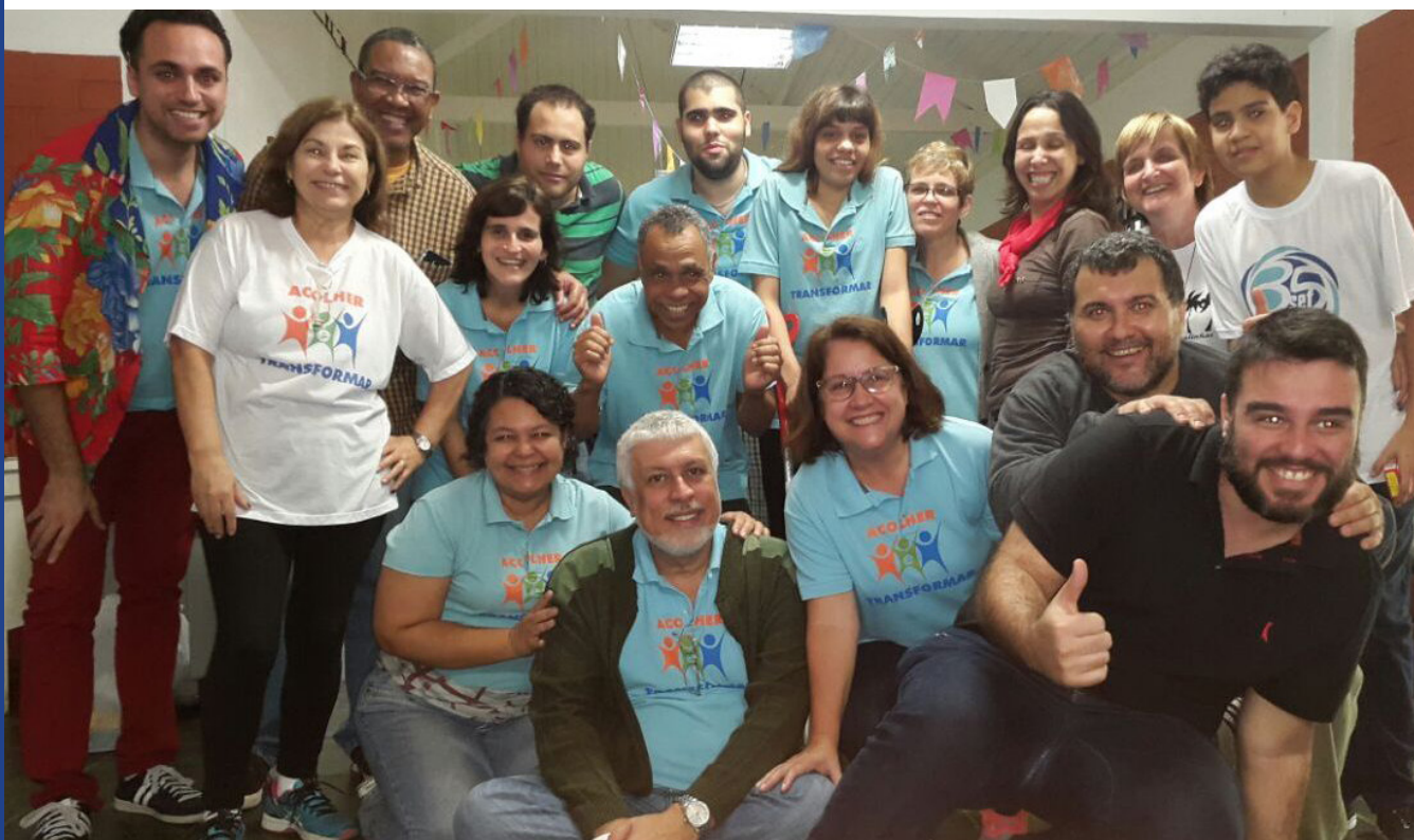
Equipe do Projeto Acolher é Transformar