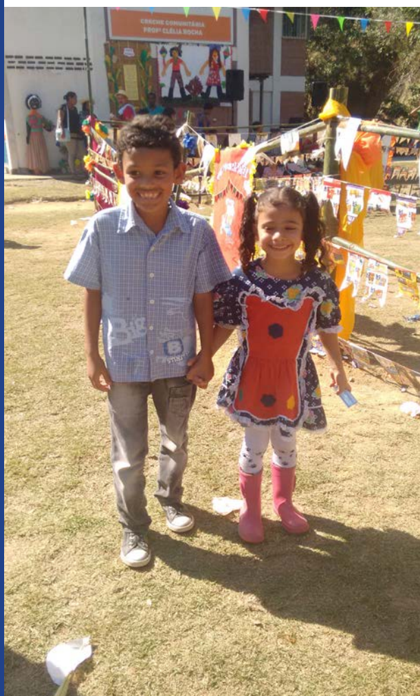
Trajes típicos encantam

No último dia 15 de Julho, numa manhã ensolarada e quente de inverno, o Núcleo Educacional Professora Clélia Rocha esteve em festa. Toda a escola se preparou para, com muita animação, receber as famílias para este evento que, além de confraternização, também tem um propósito pedagógico importante.