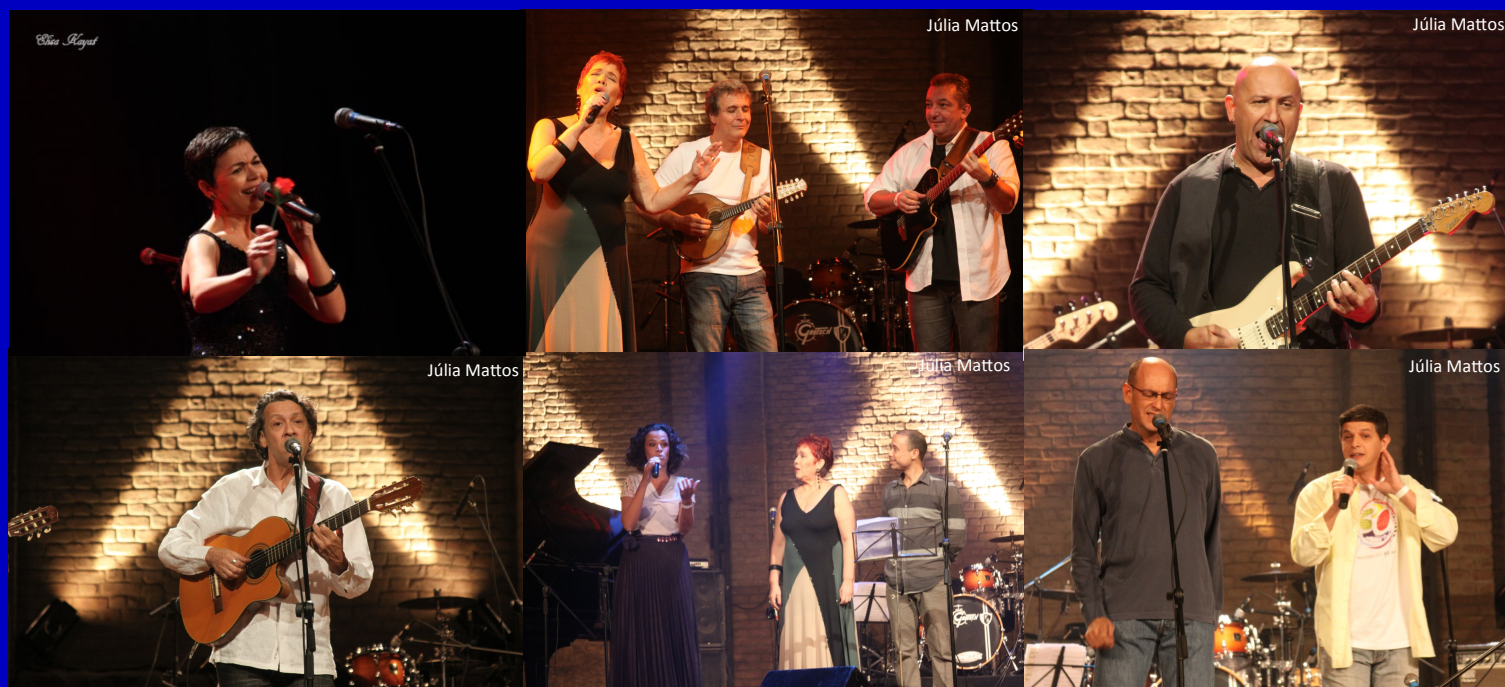
Alguns dos artistas que nos brindaram com suas brilhantes apresentações

Para ver a galeria com todas as fotos do show