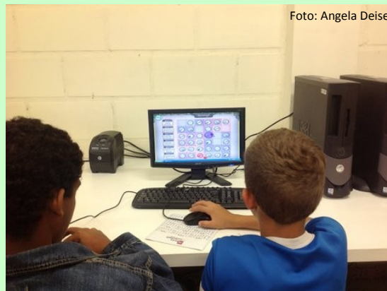
Crianças mexendo no game