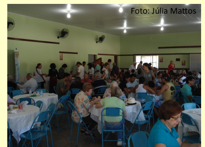
Almoço fraterno em Rio Bonito