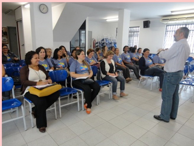
As ações visam melhorar a equipe de professores do Remanso

Uma das mais preciosas oportunidades de formação tem acontecido na UFF, onde, desde 2009 nossos educadores vêm participando do curso anual “Pedagogia Social no Século XXI”, promovido em conjunto pela CAPEMISA Social e pelo Projeto PIPAS, do Departamento de Educação. Esse curso tem como finalidade “possibilitar aos educadores sociais (professores, pedagogos, assistentes sociais, psicólogos e profissionais de áreas afins) uma gama de informações reflexivas sobre as demandas do trabalho junto a escolas, entidades de assistência social, crianças, adolescentes e suas famílias em situação de vulnerabilidade social, no sentido de oportunizar uma prática pedagógica inclusiva”.