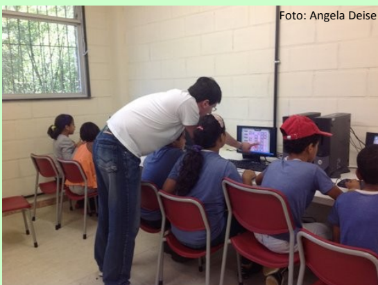
Voluntário ensinando o game Bioma Mata Atlântica