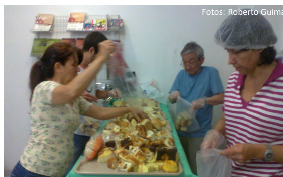
Voluntários acondicionando os pães doados