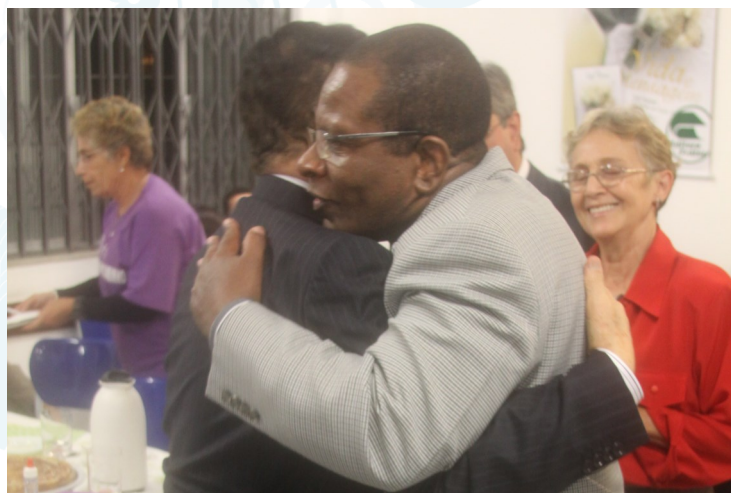
Abraço entre os dois amigos