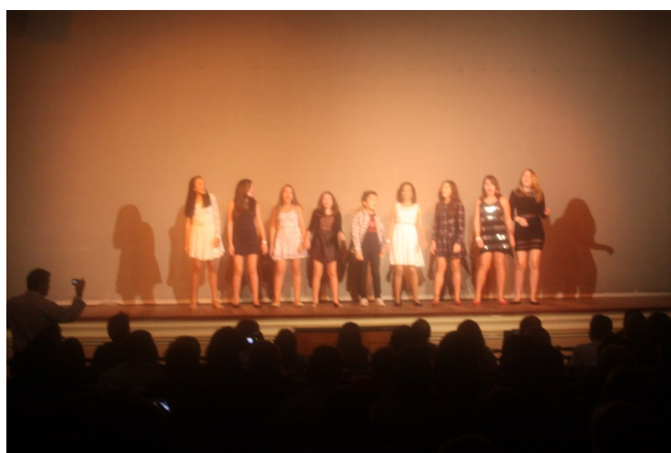
Coral infantil abriu a noite de apresentações