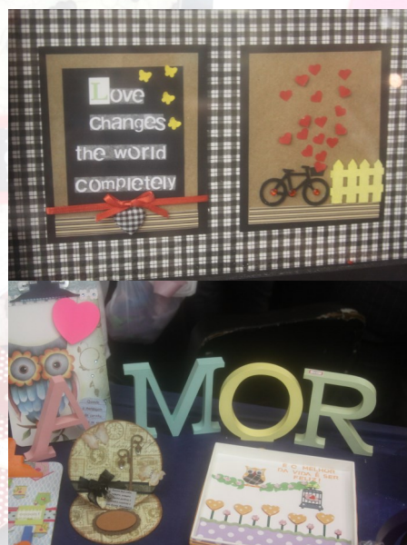
Os produtos são feitos com carinho

Voluntários são sempre bem-vindos e quem tiver interesse é só entrar em contato pelo endereço eletrônico: crismcc@gmail.com .