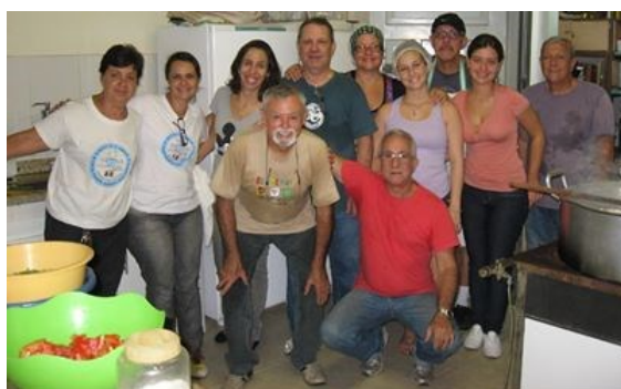
Parte da equipe que participa desse trabalho